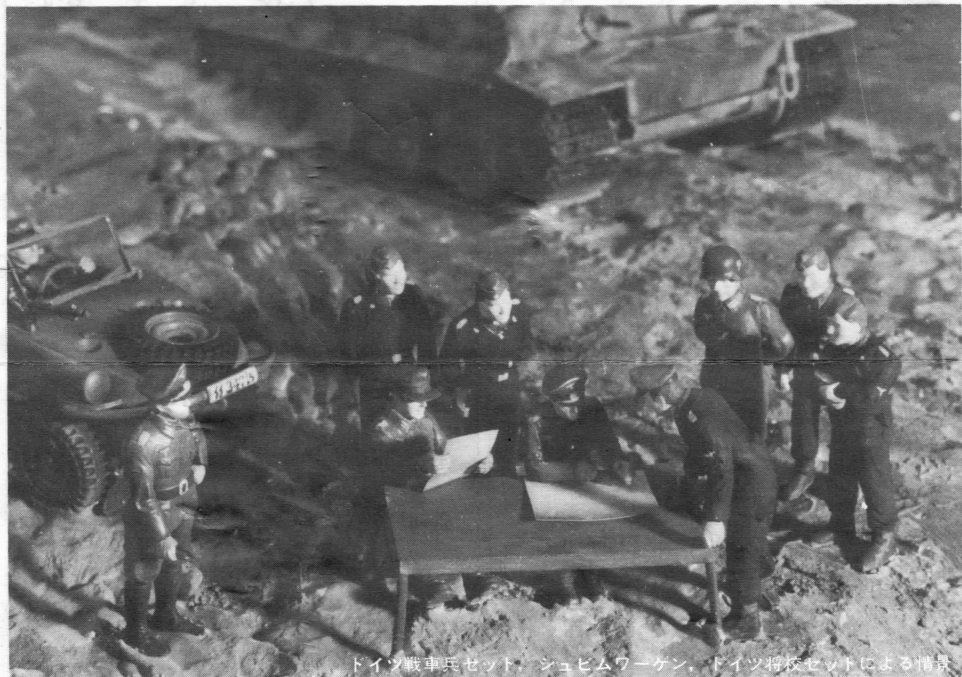
ドイツ戦車兵セット、シュヒムワーゲン、ドイツ将校セットによる情景