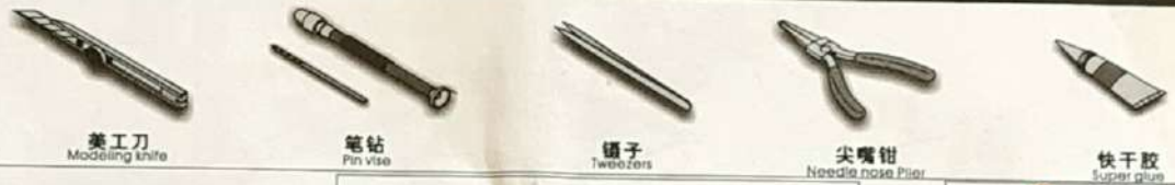
美工刀 Modeling knife