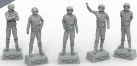
Modern pilots Russia Air Force NAZ-IR (SVO)

To attach resin parts use cyanoacrylate glue. Для склеивания деталей использовать цианоакрилатный клей