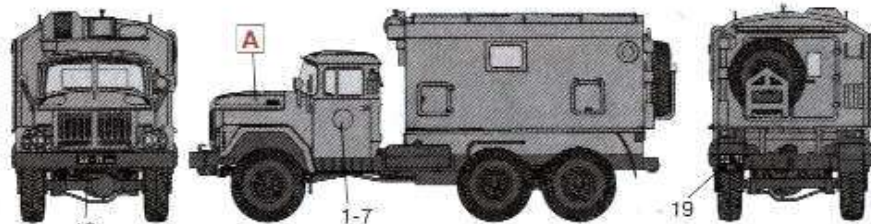
Стандартная окраска автомобилей «Зил-131» Standard painting scheme of ZIL-131 vehicles