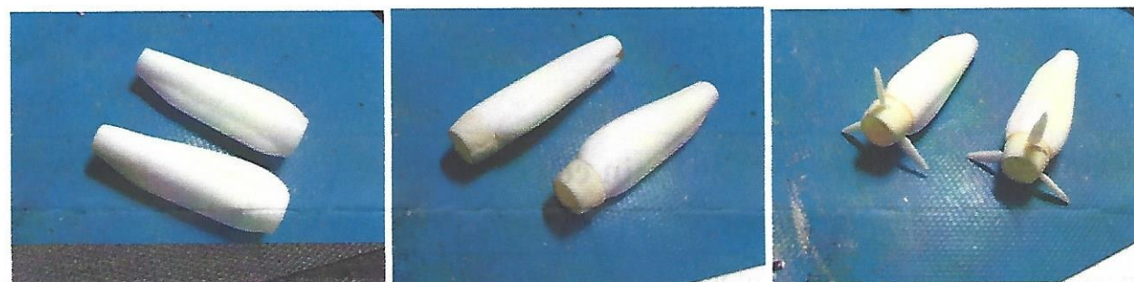
Bild links (picture on the left): Triebwerkshälften (je 2) zusammenkleben. // Please connect the engine parts (2 each).

Bild in der Mitte (picture halfway): Lufteinlauf (je zwei Teile) befestigen. // Please fix the air intake parts (2 each).