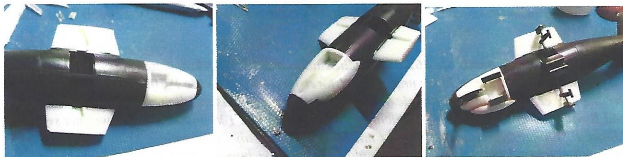
Bild links (picture on the left): Basismodell aufbauen, Bugfahrwerksschacht in Resin einbauen und Flügelansatzstücke ankleben. // Please built the basic kit and add the front undercarriage bay (resin part) and also the inner wings.

Bild in der Mitte (picture halfway): Kanonenmagazin auf der rechten Rumpfbugseite befestigen. // Please fix the canon magazine on the right fuselage side.