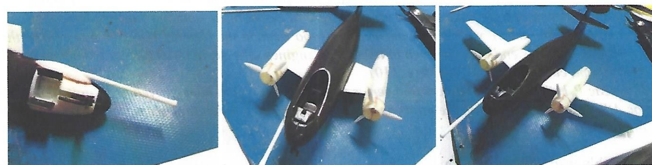
Bild links (picture on the left): Kanone am Magazin ankleben. // Please fix the canon on the magazine.

Bild in der Mitte (picture halfway): Triebwerke an den Innenflügeln befestigen. // Please fix the turbo prop engines on the inner wings.