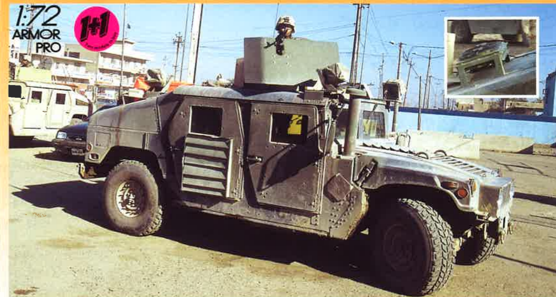
HUMVEE is a registered trademark of AM General LLC, and is used under license from AM General LLC. © AM General LLC 2007. All rights reserved.