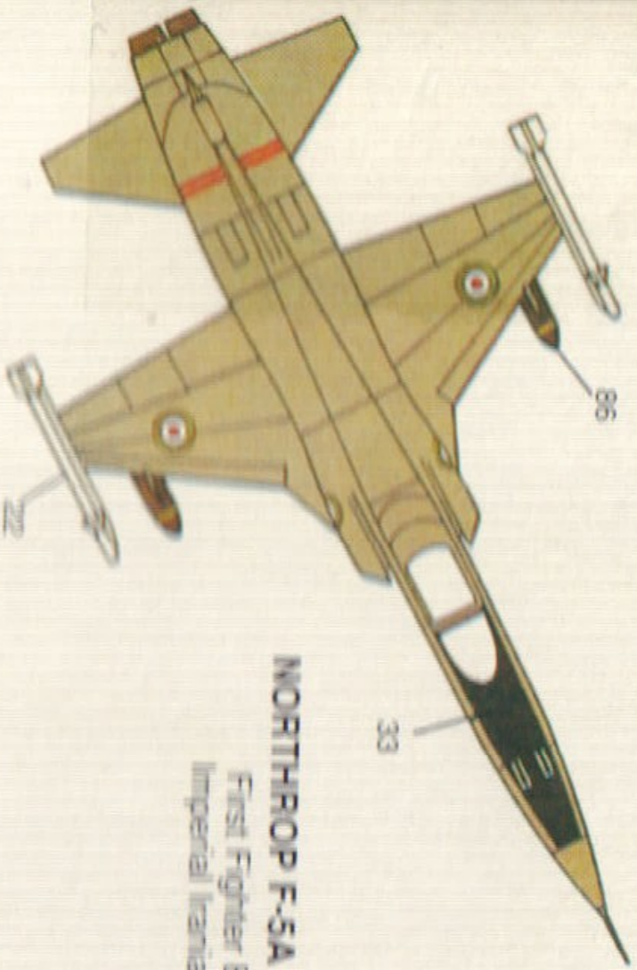
NORTHROP F-5A FREEDOM FIGHTER First Fighter Base, Mehrabad, Imperial Iranian Air Force 1965