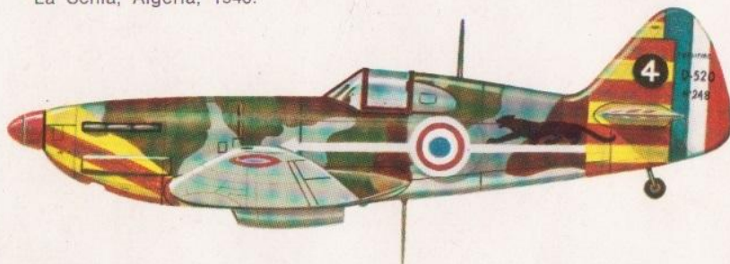
DEWOITINE 520 n. 248, G.C.II/7, 4 ème Escadrille, Vichy Air Force. Gabes, Tunisia, 1942.