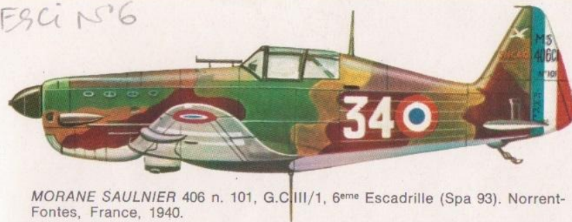
MORANE SAULNIER 406 n. 101, G.C.III/1, 6 ème Escadrille (Spa 93). Norrent-Fontes, France, 1940.