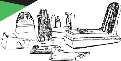
Cockpit set (suitable for Su-25 ArtModel kit)

To attach resin parts use cyanoacrylate glue. Для склеивания деталей использовать цианоакрилатный клей