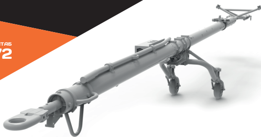
Airfield tow bar (suitable for all Su-27 model kits)

To attach resin parts use cyanoacrylate glue. Для склеивания деталей использовать цианоакрилатный клей